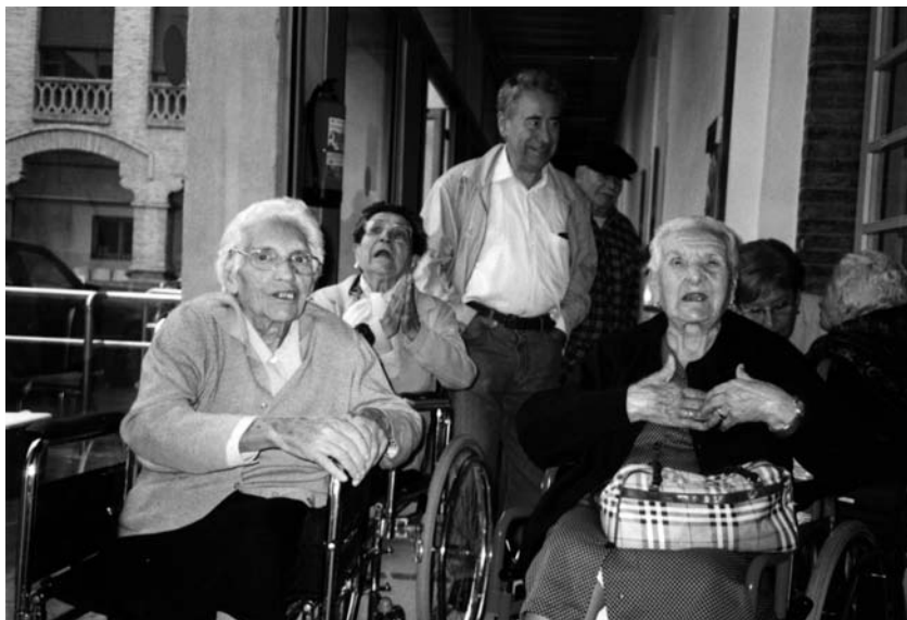
Una estona de lleure amb els avis de la Casa d'Empara. 2004.