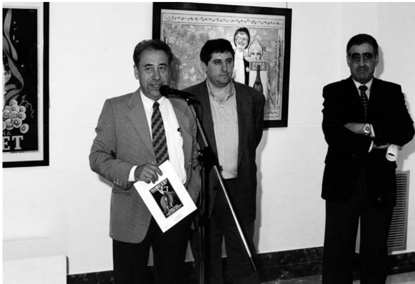
Inauguració de l'exposició "De l'art de la publicitat al col·leccionisme" al Fòrum Berger Balaguer de Vilafranca del Penedès, com a Cap d'Obra Social de Caixa Penedès. Maig 1999.