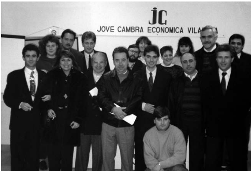
Trobada de la Jove Cambra de Vilanova al local social. 1985, aprox.