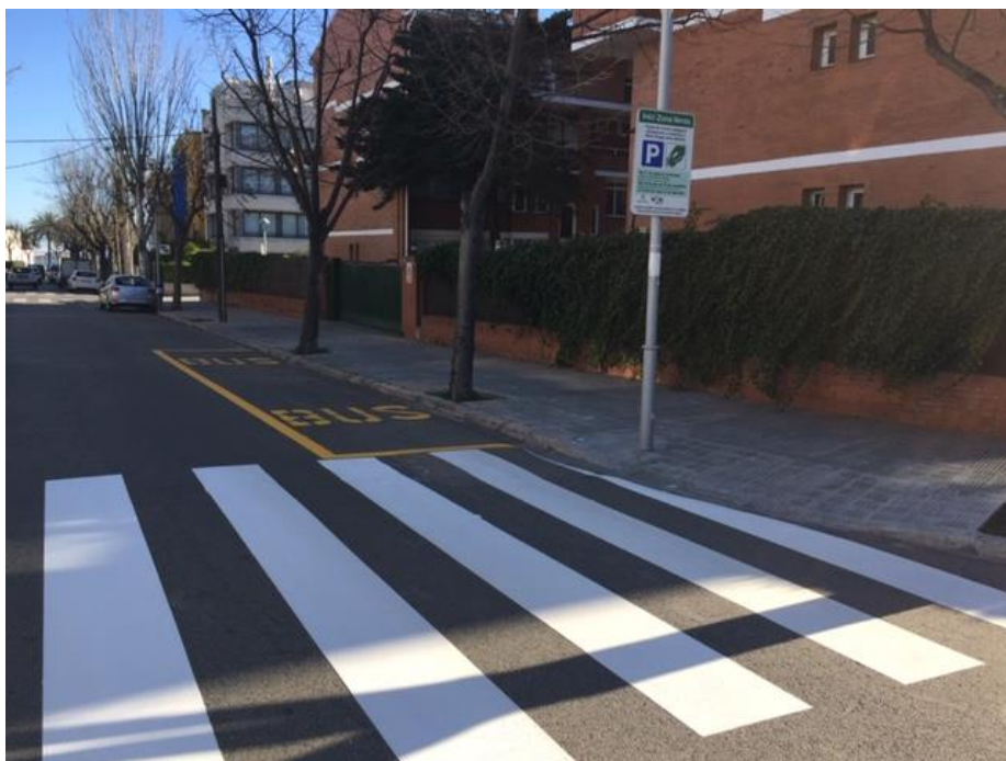
Nova ubicació de la parada a tocar de la vorera