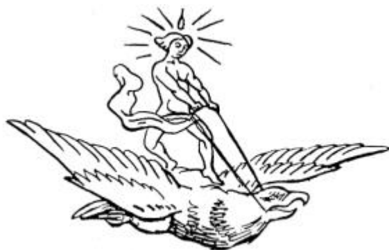
(Marca de la Sociedad pro máquina de volar, 1902)

La conclusió de la comissió tècnica feia referència que: