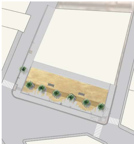
Plànol U.6. Proposta – Planta