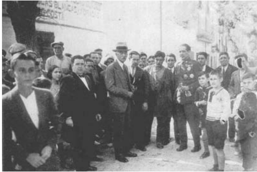
Abril de 1915. Visita a les Borges Blanques com a Diputat escollit al seu districte electoral.