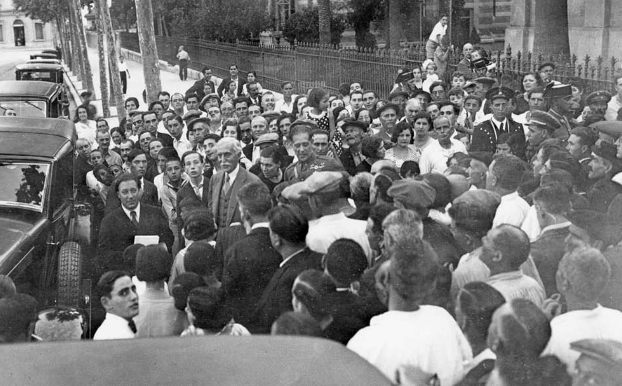
Visita del President a Vilanova i la Geltrú en motiu de l'acte d'homenatge al poeta Manuel de Cabanyes organitzat al Museu Víctor Balaguer, el dia 26 d'agost de 1933.