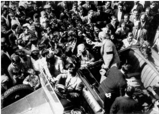
Octubre de 1932. Visita a les Borges Blanques com a President de la Generalitat.